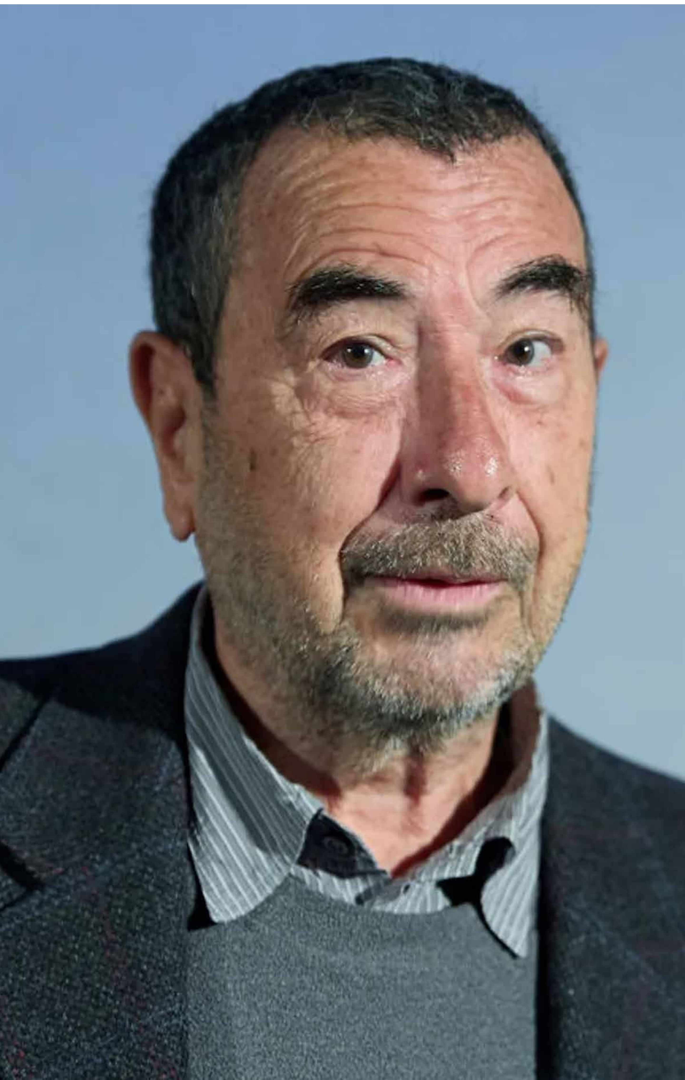
José Luis Garci